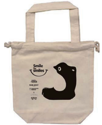
ノベルティバッグイメージ

※被災地のお子様へは、本チャリティーキャンペーンに先駆け Civic Force に支援表明をし、2011 年 4 月 5 日(火)にプレゼントさせていただきました。被災地のお子様へのチャリティーは本キャンペーンで引き続き継続していきます。